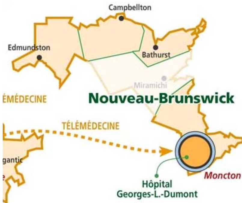
Image 2 – Réseau de stages cliniques francophones au Nouveau-Brunswick

Grâce à ce réseau exhaustif de stages cliniques, le N.-B. offre depuis une dizaine d'années, en collaboration avec la Faculté de médecine et des sciences de la santé de l'Université de Sherbrooke, le programme complet de médecine de famille qui est d'une durée de 24 mois. Le programme postdoctoral en médecine de famille est offert principalement à l'Unité de médecine familiale (UMF) de Dieppe, ainsi qu'à l'unité de formation à Edmundston et celle à Bathurst. Avec un taux de recrutement d'environ 90% des étudiants originaires du Nouveau-Brunswick qui ont fait des stages en médecine de famille en province, le succès du Programme de médecine de famille, et plus particulièrement de l'UMF de Dieppe, est évident. Quarante-six pourcent des médecins de famille arrivés au N.-B. entre 1992 et 2004 proviennent de ce programme. Dans les régions francophones, ce taux varie entre 56 à 95 %.